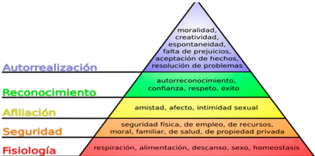
Cuadro 3. Pirámide de Maslow. 62

Maslow generó una nueva corriente de psicología que se ha denominado como corriente de “ psicología humanista ”, la cual está centrada en las necesidades y la capacidad del ser humano de buscar su propia felicidad, más que en la solución médica para lo que se percibía como problemas mentales. Y es considerado el máximo exponente de la búsqueda de la felicidad a través de la propia evolución personal y vinculación con el medio y el propio ser.